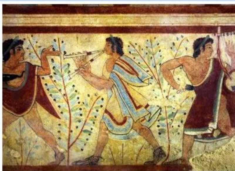
Affreschi Etruschi Tarquinia.

L'olio extra-vergine d'oliva è un alimento molto antico, tant'è che viene citato addirittura nell'Antico Testamento. Fa parte, quindi, della nostra cultura da tempi immemorabili. Anche nella Tomba dei Leopardi a Tarquinia si possono ammirare olivi carichi di frutti che fanno da sfondo a due musicisti e a un danzatore con lampada votiva.