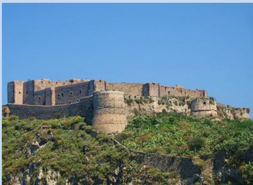
Castello di Milazzo (ME).

Il Castello di Milazzo, svetta sul paesaggio di Milazzo alla sommità dell'antico "Borgo" rappresentando uno dei complessi fortificati più grandi d'Europa. Il complesso castrale fonda le ragioni della sua collocazione sullo straordinario valore strategico della penisola di Milazzo che si protende verso le Eolie, a presidio di una rada naturale che ha costituito da sempre uno dei porti più importanti della Sicilia.